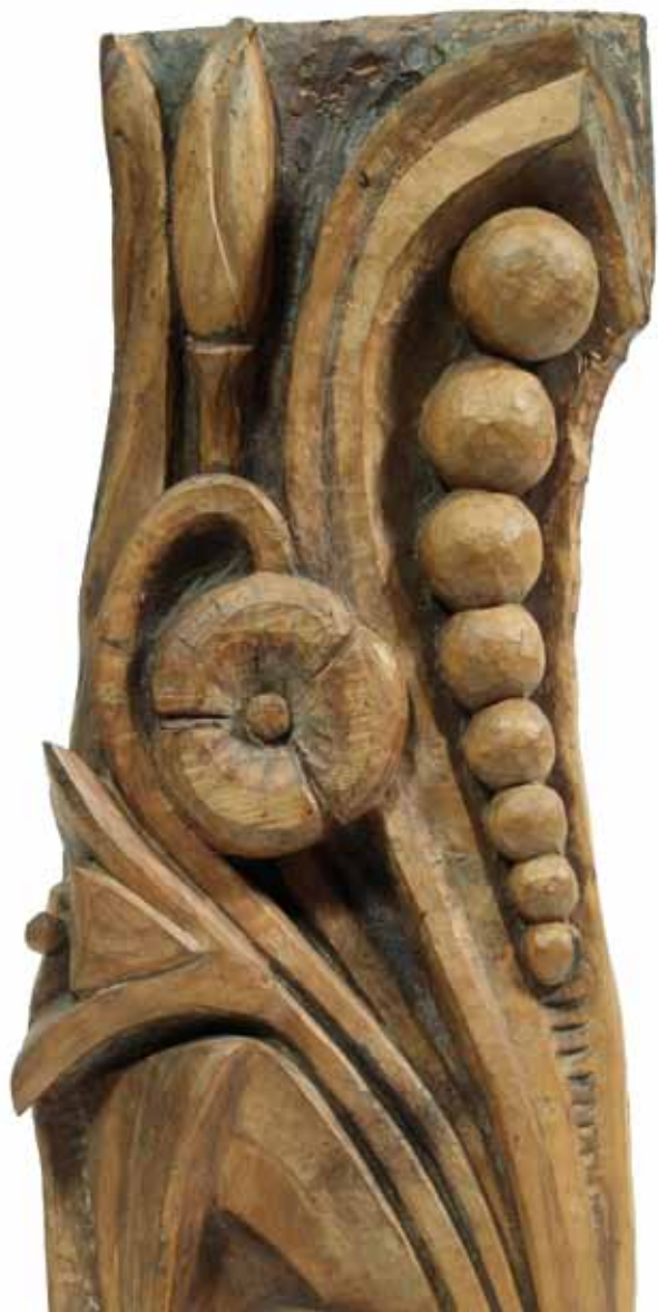
Flaviano Giovanni Laghi, Fiori , legno, 58,5x24,5x6, 1975 ca..