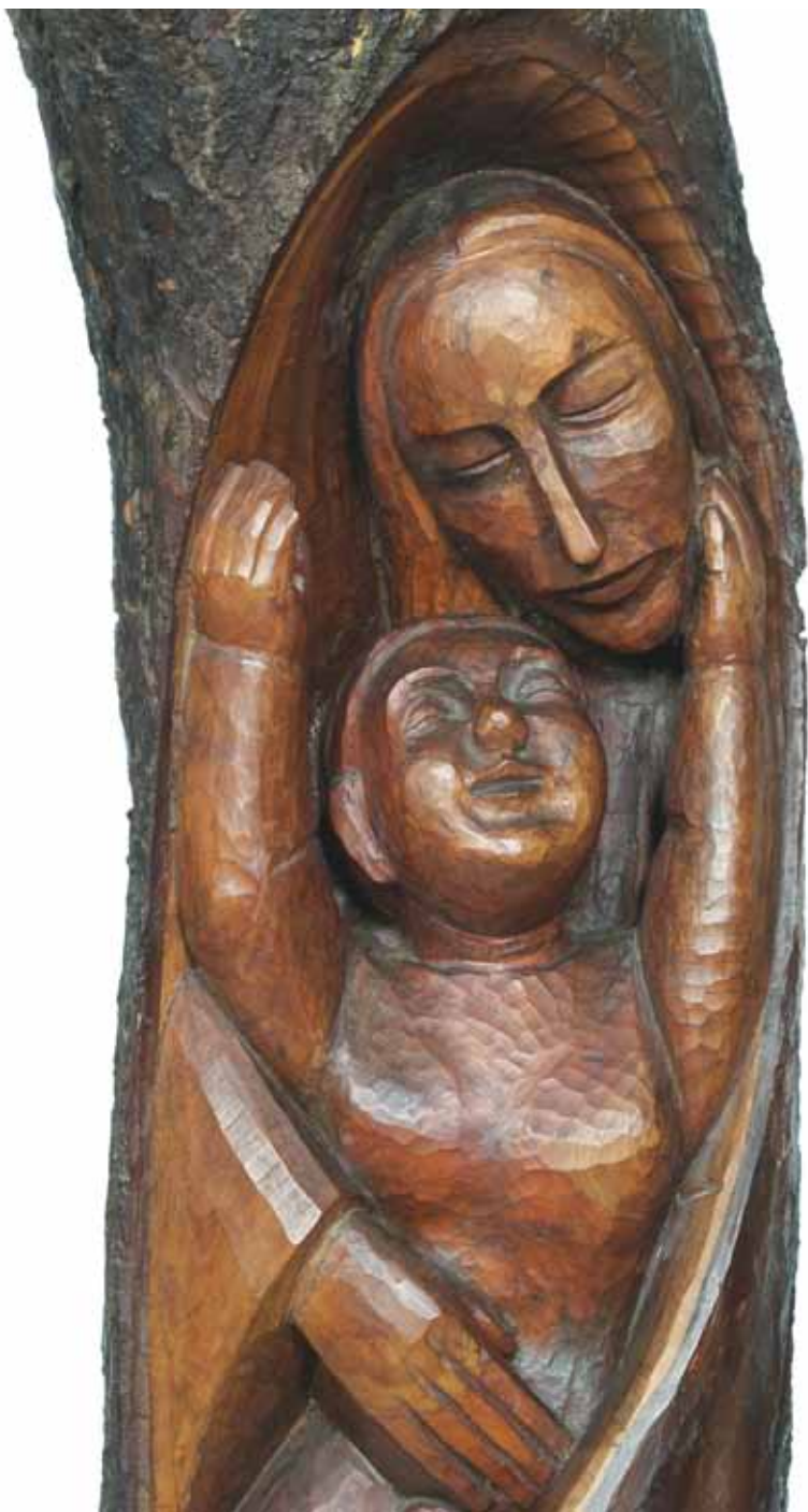
Flaviano Giovanni Laghi, Maternità , legno di ciliegio, 117x37x32, 1970.