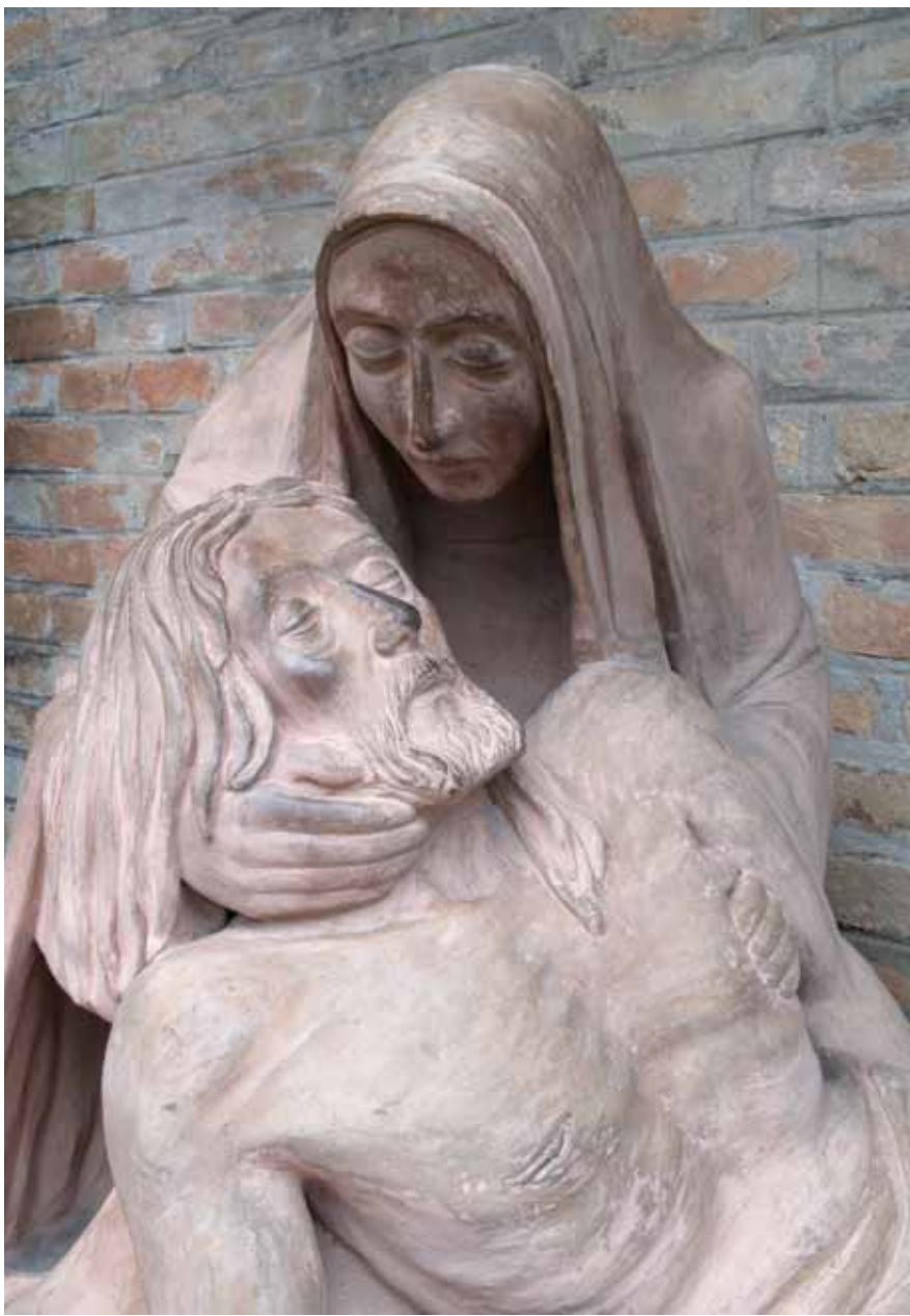
Flaviano Giovanni Laghi, Pietà , terracotta, 75x155x68, 1955.