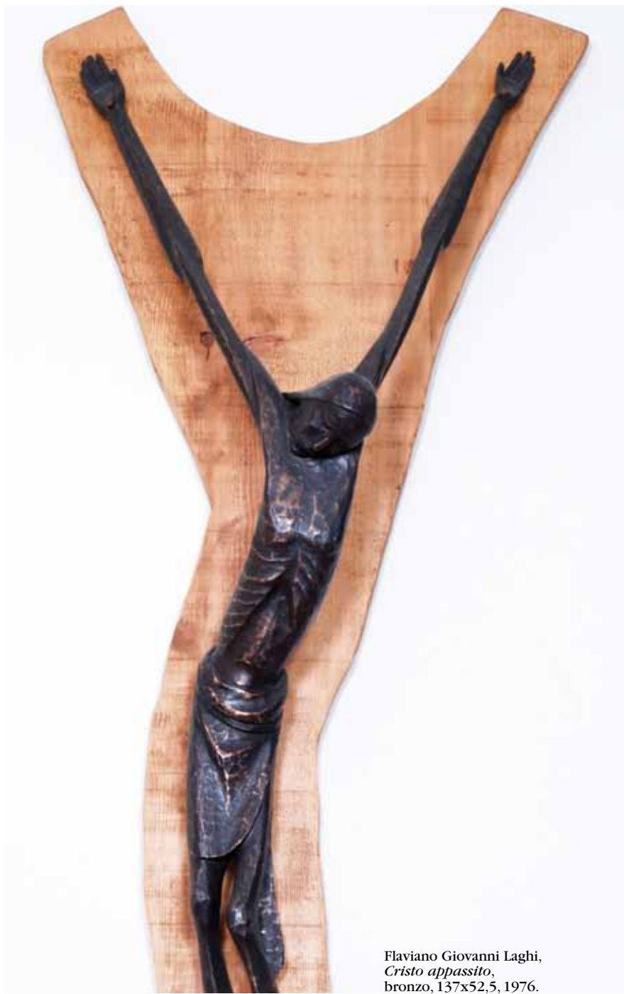
Flaviano Giovanni Laghi, Cristo appassito , bronzo, 137x52,5, 1976.