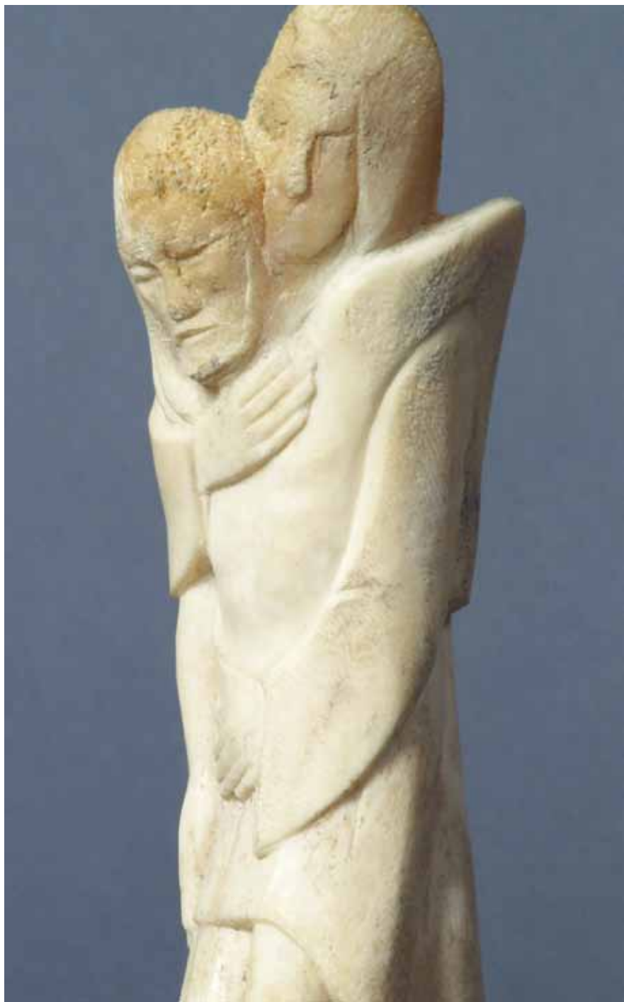
Flaviano Giovanni Laghi, Pietà , osso su base lignea, 23x9,5x6,5, 1983.