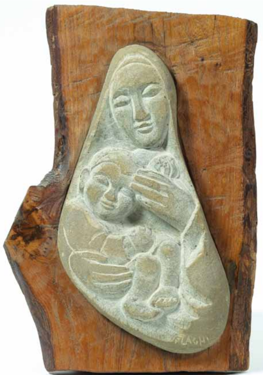
Flaviano Giovanni Laghi, Maternità , sasso infisso su legno di tronco, 31,5x21,5, 1980 ca..