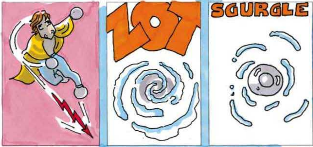
E DEI FULMINI I TUOI MINISTRI.