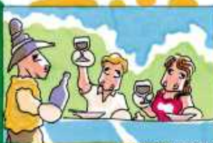
UNICI DI OLIO IL MIO CAPO, IL MIO CALICE TRABOCCA.