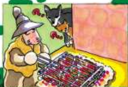
DAVANTI A ME TU PREPARI UNA MENSA SOTTO GLI OCCHI DEI MIEI NEMICI.