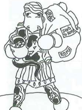
ENEAS: PERDENTE MA PRATICO, L'UNICO A USCIRE DAL DRAMMA CON UNA DOTÈ PER GARANTIRSI UN FUTURO