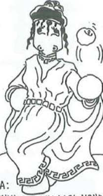
ELENA: LA DONNA PIÙ BELLA DEL MONDO, SONO NOTI I CASINI PRODOTTI DALL'ACCOPIATA DONNA-MELA