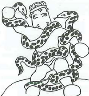
LAOCOONTE: FARSI STRITOLARE DAI SERPENTI CON TANTA GRAZIA DIMOSTRA UNA VOLTA DI PIÙ CHE LA CLASSE NON È ACQUA