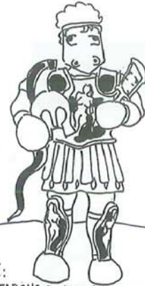
PARIDE: FANFARONE E VANITOSO, NON SI SA PERCHÉ NON ABBAI INTRAPRESO LA CARRIERA DI CALCIATORE