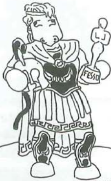
MENELAO: GIÀ ARCHETIPO DI CORNUTO, RIUSCÌ A SPECIALIZZARSI ULTERIORMENTE DIVENENDO "CORNUTO E MAZZIATO"