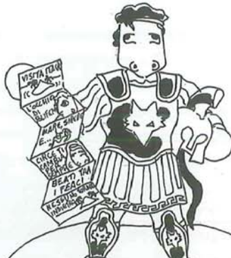
ULISSE: LA SUA VERA ASTUZIA FU LAVORARE PER IL COLOSSAL E ASSICURARSI IL SERIAL