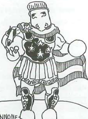
AGAMENNONE: SEMPRE PRONTO, CON QUALSIASI PRETESTO, A INVADERE I TERRITORI DELLE CITTÀ-CANAGLIA