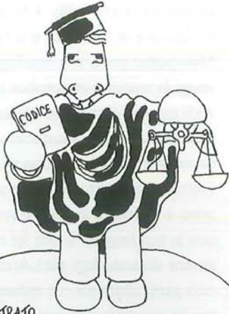
MAGISTRATO CHE GARANTISCE L'UGUAGLIANZA TRA I CITTADINI