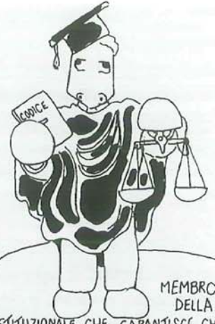
MEMBRO DELLA CORTE COSTITUZIONALE CHE GARANTISCE CHE OGNI LEGGE GARANTISCA L'UGUAGLIANZA TRA I CITTADINI