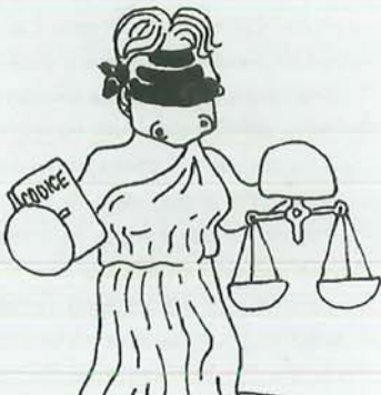
GIUSTIZIA CHE OLTRE CHE CIECA SPERA DI DIVENTARE ANCHE SORDA TANTO NE HA SENTITE DIRE SU DI LEI