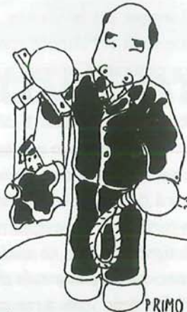
PRIMO MINISTRO CHE ATTENTA ALL'AUTONOMIA DELLA MAGISTRATURA