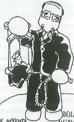
ESPONENTE DELLA MAGGIORANZA ALL'AUTONOMIA DELLA MAGISTRATURA AVENDOLO VISTO FARE DAL SUO CAPO