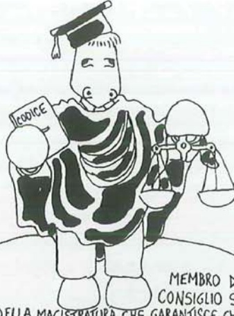
MEMBRO DEL CONSIGLIO SUPERIORE DELLA MAGISTRATURA CHE GARANTISCE CHE IL MAGISTRATO GARANTISCA L'UGUAGLIANZA TRA I CITTADINI