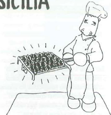
COZZE RADIOATTIVE AUTOCUOCENTI SENZA USO DI FIAMMA E CARBONELLA