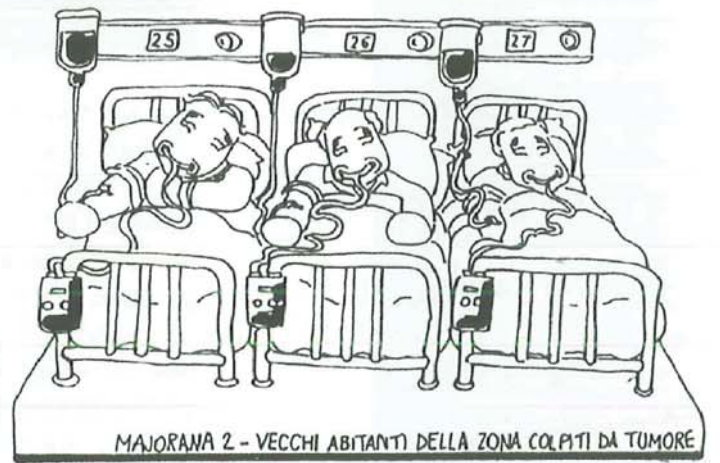
MAJORANA 2 - VECCHI ABITANTI DELLA ZONA COLPITI DA TUMORE