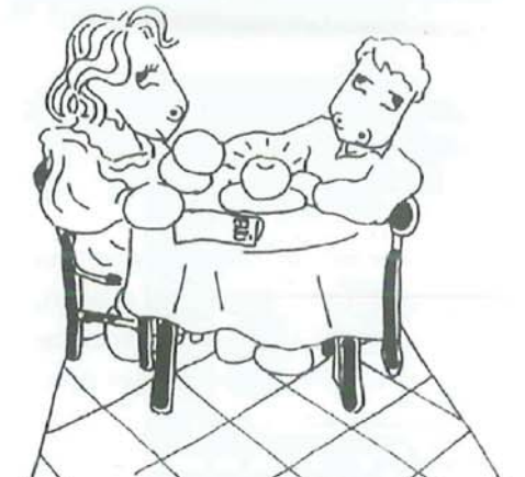
FRUTTA FOSFORESCENTE PER CENETTE AL LUME DI PESCA