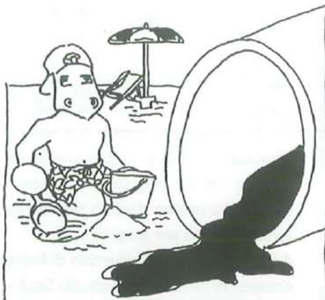
SCARICO ABUSIVO DEL POLO CHIMICO A PRIOLO