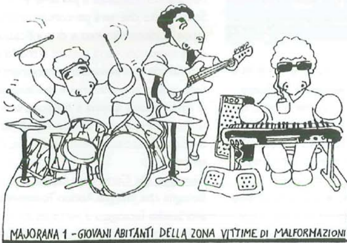
MAJORANA 1 - GIOVANI ABITANTI DELLA ZONA VITTIME DI MALFORMAZIONI