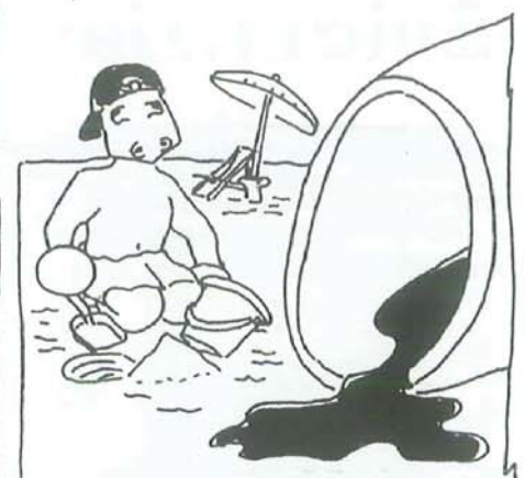
SCARICO ABUSIVO DEL POLO CHIMICO A MELILLI