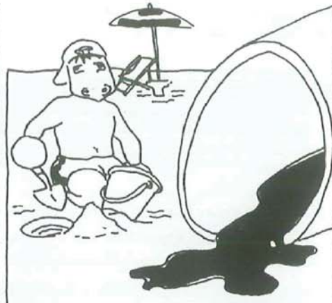
SCARICO ABUSIVO DEL POLO CHIMICO AD AUGUSTA