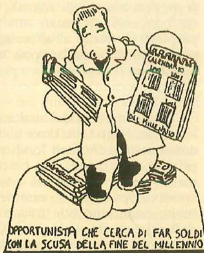
OPPORTUNISTA CHE CERCA DI FAR SOLDI CON LA SCUSA DELLA FINE DEL MILLENNIO