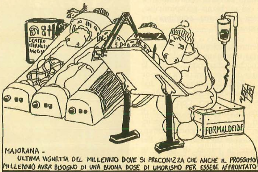
MAJORANA - ULTIMA VIGNETTA DEL MILLENNIO DOVE SI PRECONIZZA CHE ANCHE IL PROSSIMO MILLENNIO AVRA BISOGNO DI UNA BUONA DOSE DI UMORE PER ESSERE AFFRONTATO