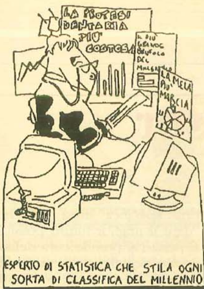
ESPERTO DI STATISTICA CHE STILA OGNI SORTA DI CLASSIFICA DEL MILLENNIO