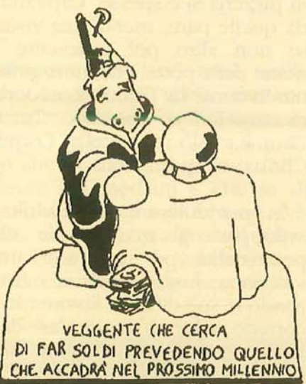
VEGGENTE CHE CERCA DI FAR SOLDI PREVEDENDO QUELLO CHE ACCADRÀ NEL PROSSIMO MILLENNIO