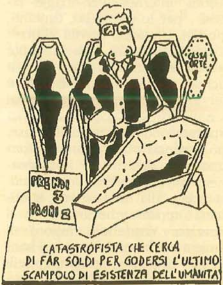
CATASTROFISTA CHE CERCA DI FAR SOLDI PER GODERSI L'ULTIMO SCAMPOLO DI ESISTENZA DELL'UMANITÀ