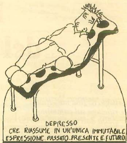
DEPRESSO CHE RIASSUME IN UN'UNICA IMMUTABILE ESPRESSIONE: PASSATO, PRESENTE E FUTURO