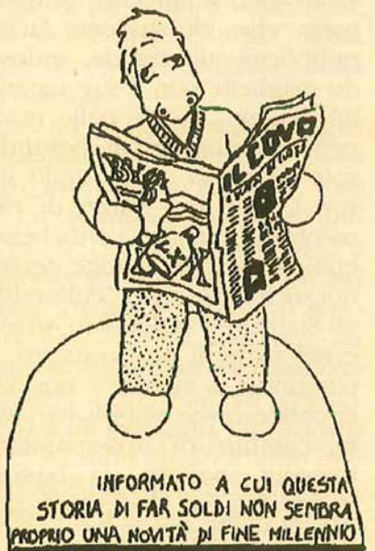
INFORMATO A CUI QUESTA STORIA DI FAR SOLDI NON SEMBRA PROPRIO UNA NOVITÀ DI FINE MILLENNIO