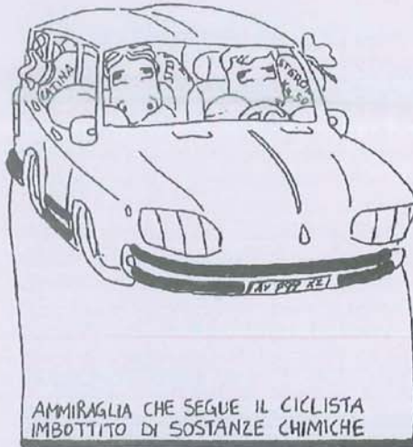
AMMIRAGLIA CHE SEGUE IL CICLISTA IMBOTTITO DI SOSTANZE CHIMICHE