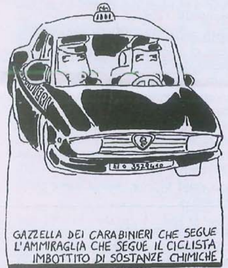
GAZZELLA DEI CARABINIERI CHE SEGUE L'AMMIRAGLIA CHE SEGUE IL CICLISTA IMBOTTITO DI SOSTANZE CHIMICHE