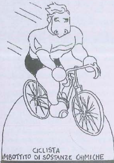
CICLISTA IMBOTTITO DI SOSTANZE CHIMICHE