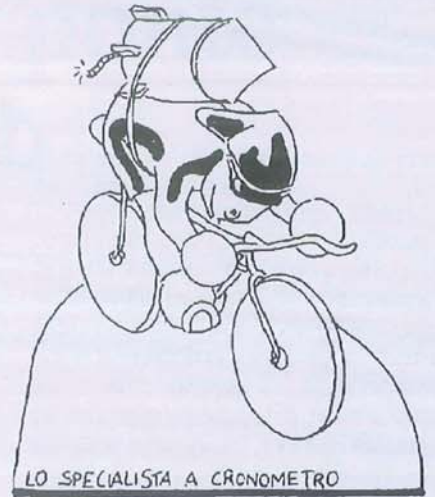
LO SPECIALISTA A CRONOMETRO