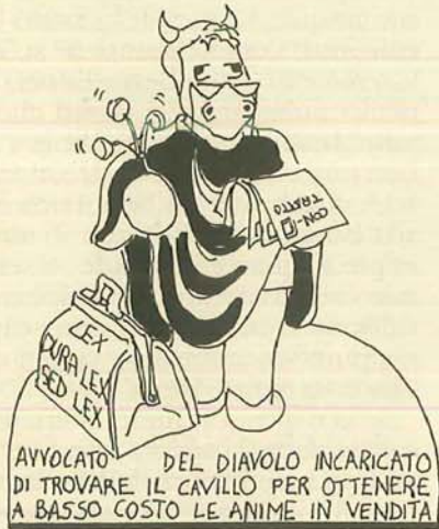
AVVOCATO DEL DIAVOLO INCARICATO DI TROVARE IL CAVILLO PER OTTENERE A BASSO COSTO LE ANIME IN VENDITA