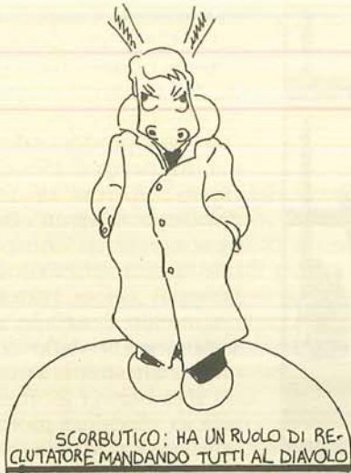
SCORBUTICO: HA UN RUOLO DI RECLUTATORE MANDANDO TUTTI AL DIAVOLO