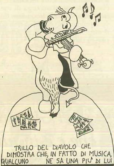
TRILLO DEL DIAVOLO CHE DIMOSTRA CHE, IN FATTO DI MUSICA, QUALCUNO NE SA UNA PIU' DI LUI