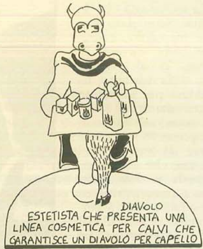
DIAVOLO ESTETISTA CHE PRESENTA UNA LINEA COSMETICA PER CALVI CHE GARANTISCE UN DIAVOLO PER CAPELLO