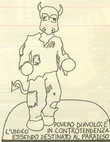
POVERO DIAVOLO; È IN CONTROTENDENZA ESSENDO DESTINATO AL PARADISO