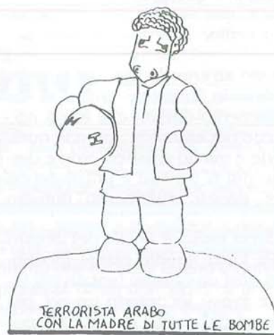
TERRORISTA ARABO CON LA MADRE DI TUTTE LE BOMBE