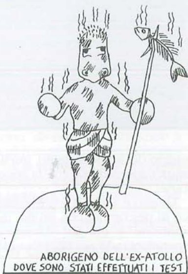
ABORIGENO DELL'EX-ATOLLO DOVE SONO STATI EFFETTUATI I TEST