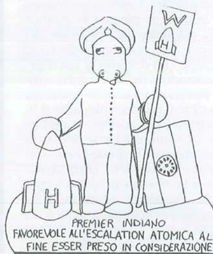
PREMIER INDIANO FAVOREVOLE ALL'ESCALATION ATOMICA AL FINE ESSER PRESO IN CONSIDERAZIONE