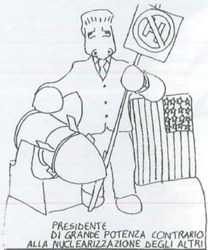
PRESIDENTE DI GRANDE POTENZA CONTRARIO ALLA NUCLEARIZZAZIONE DEGLI ALTRI