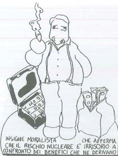
INSIGNE MORALISTA CHE AFFERMA CHE IL RISCHIO NUCLEARE E' IRRISORIO A CONFRONTO DEI BENEFICI CHE NE DERIVANO