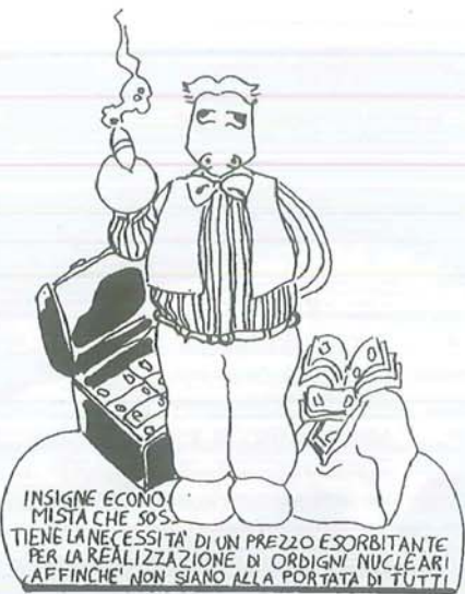
INSIGNE ECONOMISTA CHE SOSTIENE LA NECESSITA' DI UN PREZZO ESORBITANTE PER LA REALIZZAZIONE DI ORDIGNI NUCLEARI AFFINCHE' NON SIANO ALLA PORTATA DI TUTTI