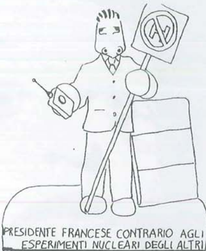
PRESIDENTE FRANCESE CONTRARIO AGLI ESPERIMENTI NUCLEARI DEGLI ALTRI