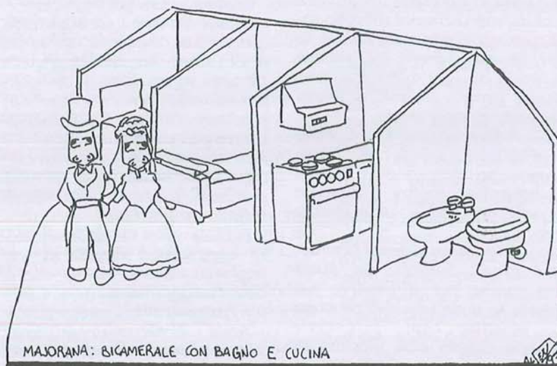
MAJORANA: BICAMERALE CON BAGNO E CUCINA