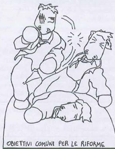
OBIETTIVI COMUNI PER LE RIFORME