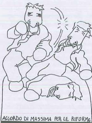
ACCORDO DI MASSIMA PER LE RIFORME