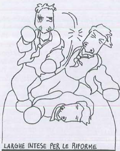
LARGHE INTESE PER LE RIFORME