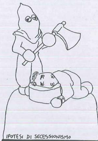
IPOTESI DI SECESSIONISMO