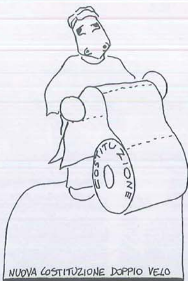
NUOVA COSTITUZIONE DOPPIO VELO