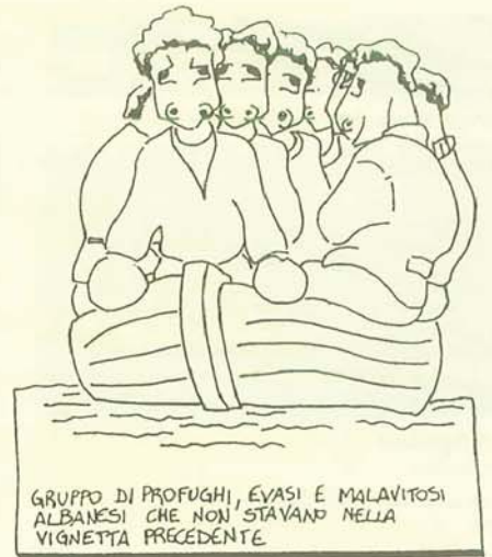
GRUPPO DI PROFUGHI, EVASI E MALAVITOSI ALBANESE CHE NON STAVANO NELLA VIGNETTA PRECEDENTE