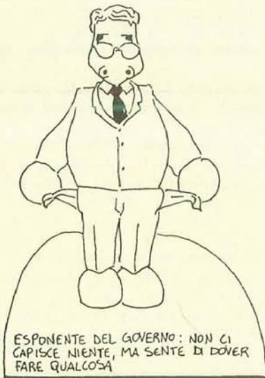
ESPOSANTE DEL GOVERNO: NON CI CAPISCE NIENTE, MA SENTE DI DOVER FARE QUALCOSA