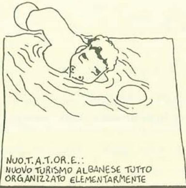
NUO.T.A.T.OR.E.: NUOVO TURISMO ALBANESE TUTTO ORGANIZZATO ELEMENTARMENTE