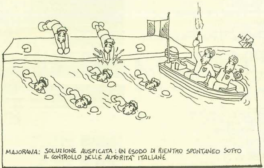
MAJORANA: SOLUZIONE AUSPICATA: UN ESODO DI RIENTRO SPONTANEO SOTTO IL CONTROLLO DELLE AUTORITA' ITALIANE