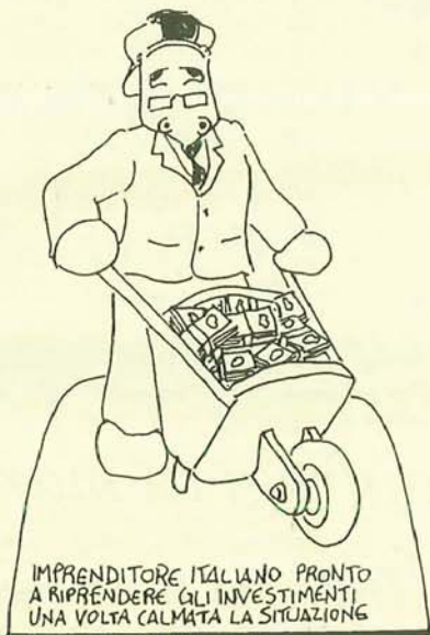
IMPRENDITORE ITALIANO PRONTO A RIPRENDERE GLI INVESTIMENTI UNA VOLTA CALMATA LA SITUAZIONE