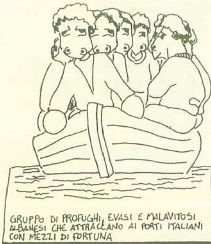
GRUPPO DI PROFUGHI, EVASI E MALAVITOSI ALBANESE CHE ATTRACCIANO AI PORTI ITALIANI CON MEZZI DI FORTUNA