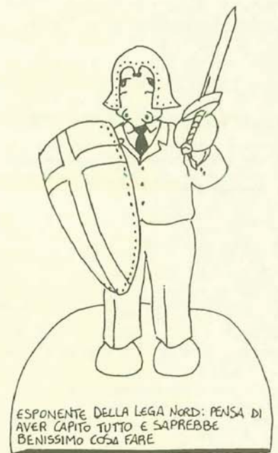
ESPOSANTE DELLA LEGA NORD: PENSA DI AVER CAPITO TUTTO E SAPREBBE BENISSIMO COSA FARE