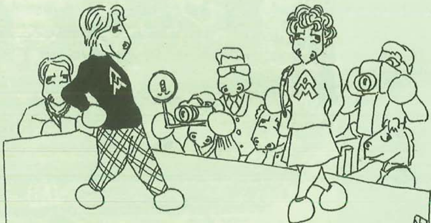
MAJORANA: PULL ANTIMAFIA CREATO DA NOTO STILISTA