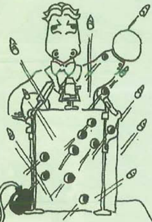
POLITICO NON COLLUSO CON LA MAFIA