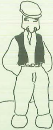
PICCIOTTO DISOCCUPATO: TERRENO FERTILE PER L'ARRUOLAMENTO