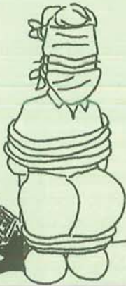
CITTADINO CONNIVENTE CON LA MAFIA