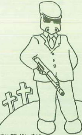
KILLER MAFIOSO: ARRUOLATO PER FERTILIZZARE IL TERRENO