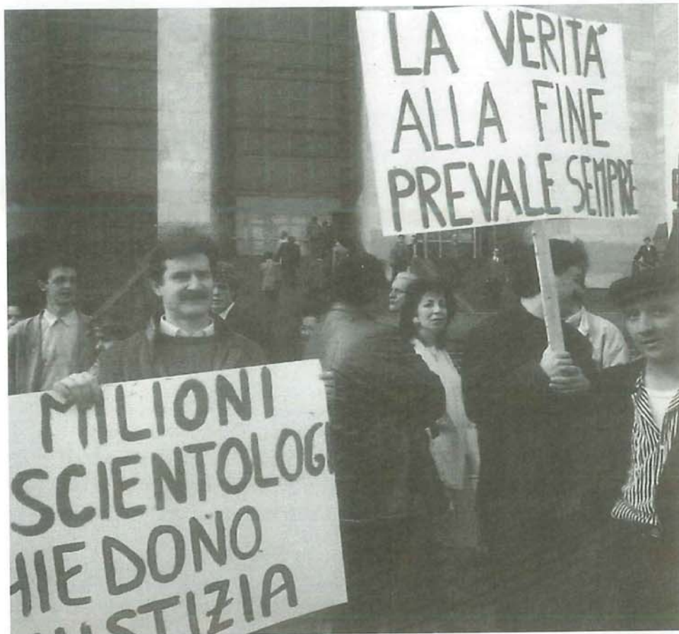
Una manifestazione di discepoli di Scientology, la setta fondata da Ron Hubbard, uno scrittore di fantascienza americano morto del 1986. 75 discepoli della setta finirono sotto processo a Milano nel 1989 per innumerevoli reati, dal raggio all'evasione fiscale

bre 1978. Ancora oggi non sono state chiarite fino in fondo le ragioni dell'eccidio al di là delle frasi farneticanti riprodotte su un nastro ritrovato nel campo della morte, in cui Jim Jones incitava i discepoli a compiere un «atto rivoluzionario» come risposta al tradimento della setta.