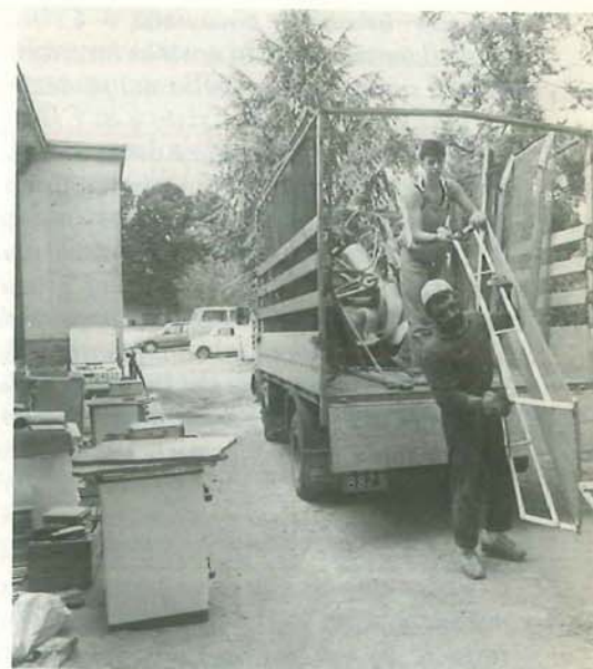
Alcune immagini dei Campi estivi. Nella pagina accanto in basso a sinistra il Campo di Lavoro a Porretta e il Campo estivo a Bellavalle. In questa pagina: due immagini del I Campo di Lavoro missionario nazionale svoltosi a Imola da 23 agosto al 5 settembre.