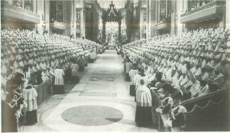
Il Concilio Vaticano II, oggetto del recente Sinodo straordinario.

ne. Occorre sentire la necessità di una formazione che sia rinnovamento, conversione, mutamento radicale di mentalità, che ci porti in ogni situazione ad «essere», specie nell'umiltà dei piccoli gesti quotidiani. In questo ci guida la Regola, che va studiata, amata, discussa insieme: essa ci mostra la strada da percorrere nella dimensione missionaria ed ecclesiale di laici.