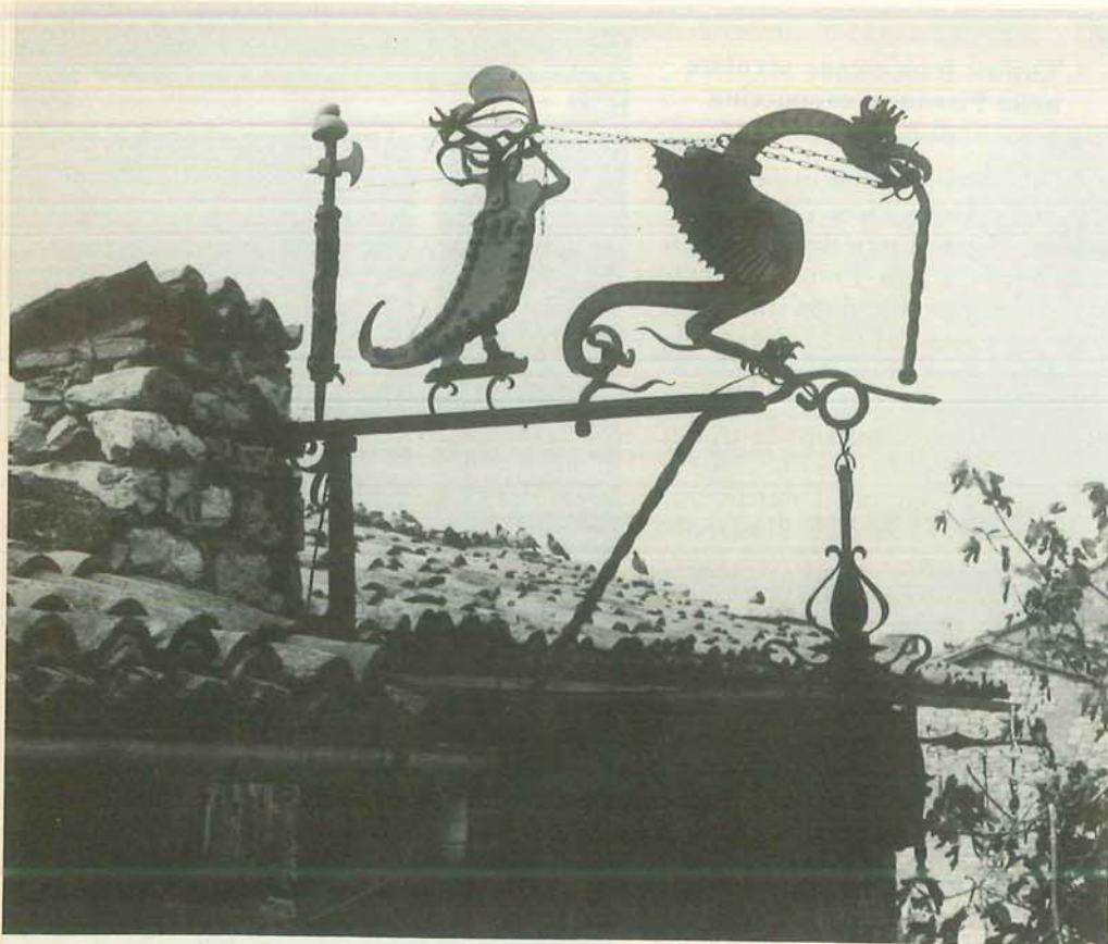
Decorazione in ferro battuto di una casa di Assisi

meditazione, il silenzio interiore, l'ascolto; da Assisi una proposta, un confronto con l'uomo, un confronto che oltrepassa i confini dell'Italia e della stessa Chiesa. I giovani francescani infatti non accettano una sudditanza né si appagano di un conferma, ma ricercano, a tu per tu con Dio, il mistero del cosmo e del cuore umano. Si fanno missionari per difendere l'utopia evangelica, confrontandosi con Francesco, la cui testimonianza si apre e si chiude con due «nudità» di rinuncia, umili e semplici, ma perentorie.